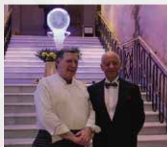
Grand Chapitre Thaïland 31 st March 2017 at Don Giovanni Restaurant @ Rembrandt Hotel Bangkok