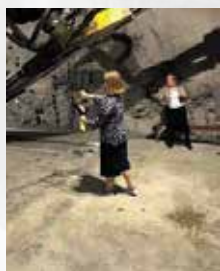
In the mine

In Stockholm there was one event in a mine and one summer meeting at one of Stockholm's scenic points.