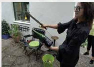
Garden party, high level of attention

In Halmstad , there were some nice arrangements including champagne testing (Vve Devaux) and a visit to the local Audi dealer.