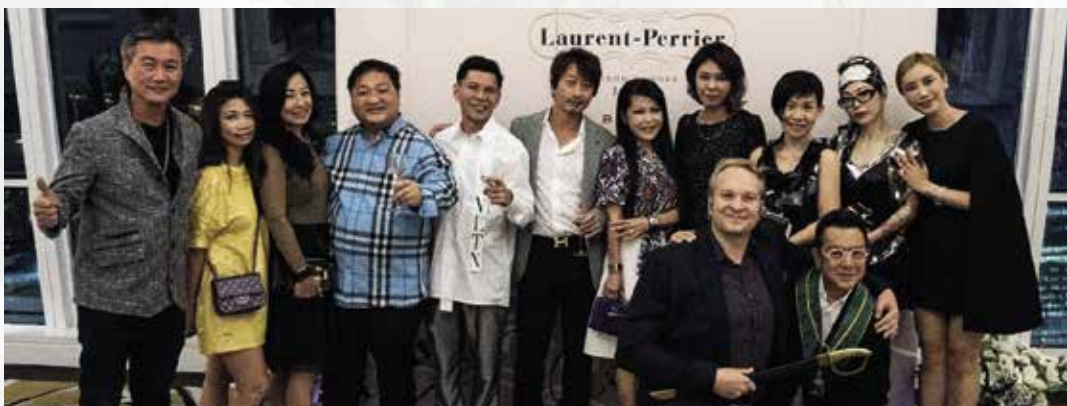
Laurent Perrier Champagne Dinner 7th September 2018 at the Tower Club