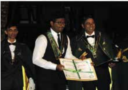
Remise de diplôme de Chevalier Sabreur au Sommelier de l'Hôtel Belle Mare Plage , par l'ambassadeur de La Confrérie du Sabre d'Or Ile Maurice.