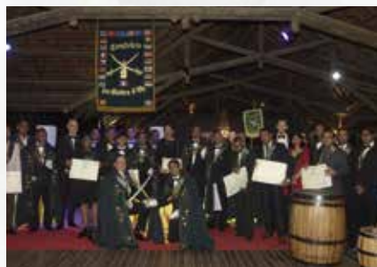
Photo de famille The Ravenala Attitude , Ile Maurice.