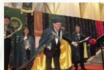
Grand Chapitre Thaïland & Caveau Opening 22 nd March 2018 at Fireplace Grill @ InterContinental Bangkok