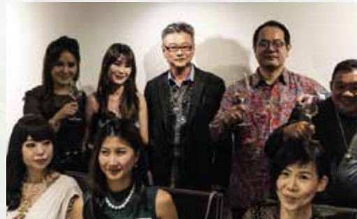
Dom Perignon Dinner 19th July 2018 at Buona Terra