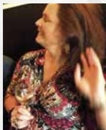
Matching ear rings(!)