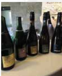
5 cuvée of Devaux

In Halmstad , there were some nice arrangements including champagne testing (Vve Devaux) and a visit to the local Audi dealer.