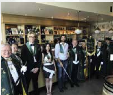
Ouverture du Caveau au Restaurant «Heritage Fine Wines» à Beverly Hills, California.