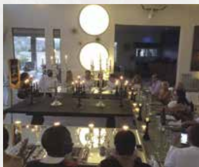
Ouverture du Caveau de Calmada Boutique Hôtel en Californie.