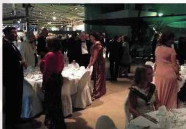
At the GC dinner tables

Last but not least, the Grand Chapitre at the Swedish air force museum in Linköping and the ambassador attending GC in Bangkok.