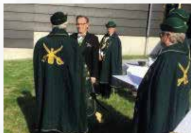
Intronisations and promotions