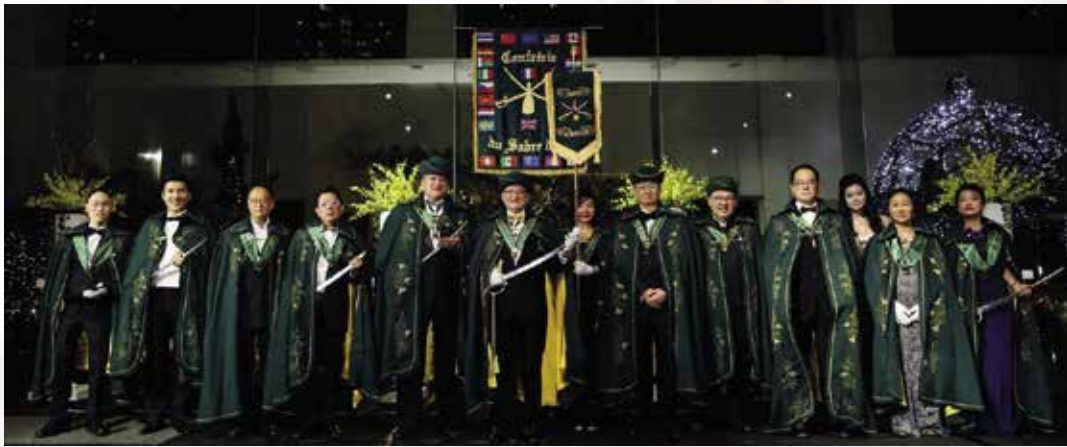
Induction & Gala Dinner 19th March 2018 at Grand Copthorne Waterfront Hotel