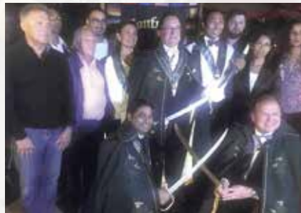
Ouverture de Caveau au restaurant La Varangue à Tana, Madagascar.