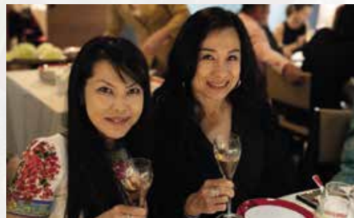
Perrier-Jouët Dinner 17th August 2018 at Majestic Restaurant