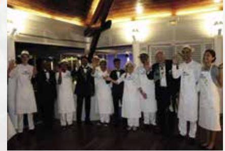
Les membres de La Confrérie et les membres du service avant le dîner de gala à l'hôtel Lux II e de la Réunion.