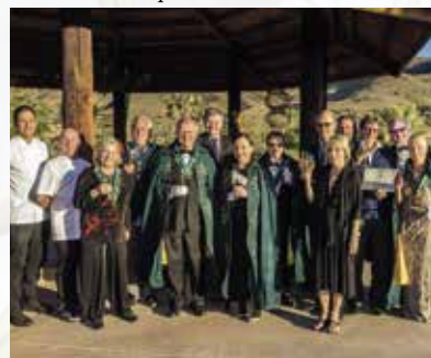
Les nouveaux membres de l'ambassade américaine intronisés à Calmada Boutique Hôtel.