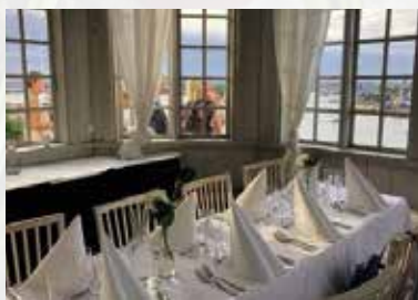
Summer meeting at "Fäfångans lusthus"

Last but not least, the Grand Chapitre at the Swedish air force museum in Linköping and the ambassador attending GC in Bangkok.