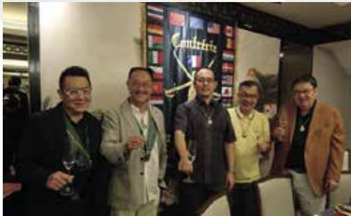
Bruno Paillard Dinner 23rd May 2018 at Tung Lok Signatures