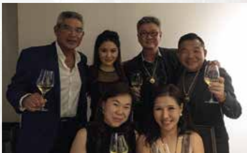
Dom Perignon Dinner 19th July 2018 at Buona Terra